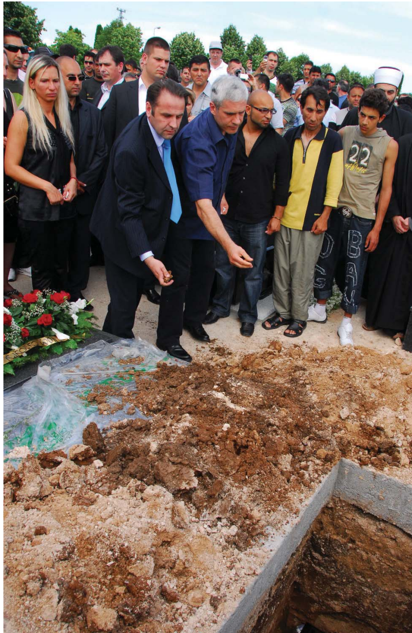
Слика 7: Председников и министаров последњи опроштај од Шабана (Д. Митић Цар, 2008)