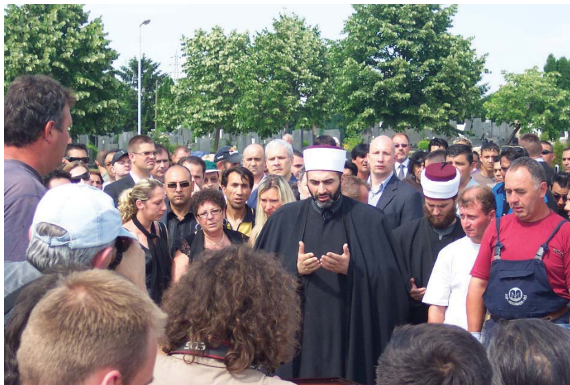
Слика 6: Муфтијина молитва над раком (Д. Тодоровић, 2008) (у позадини председник Борис Тадић)