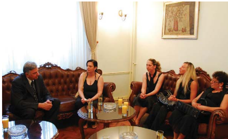
Слика 2: Фамилија Бајрамовић код градоначелника уочи комеморације (Д. Митић Цар, 2008)