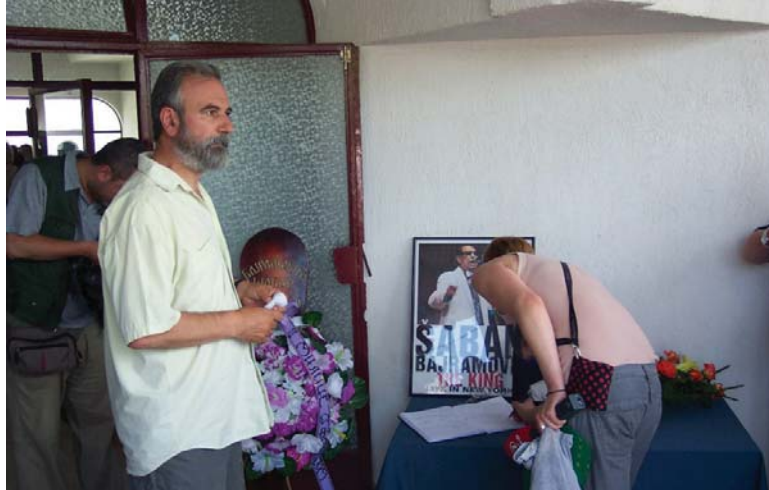
Слика 1: У реду за уписивање у књигу жалости (Д. Тодоровић, 2008)