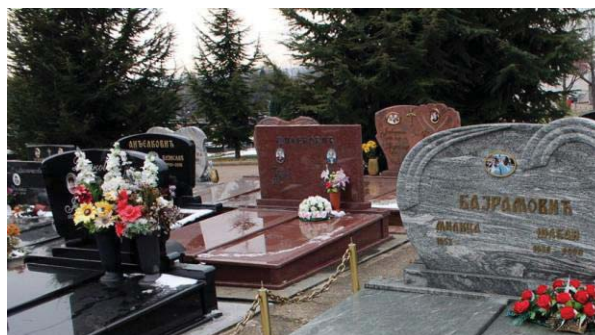
Слика 10: На мети лопова: Царев гроб (М. С., март 2017)